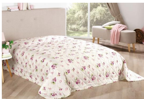
Přehoz Rosemarie, 199 Kč