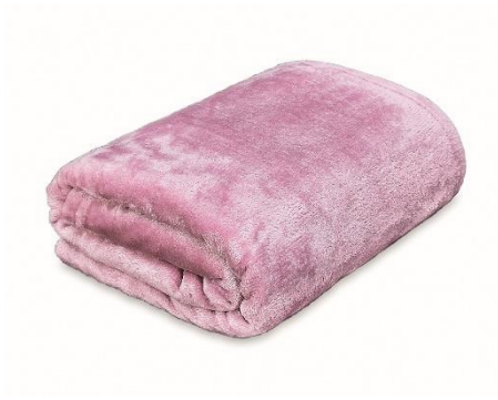
Flanelová deka, 399 Kč