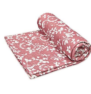
Deka Pusteblume, 299 Kč