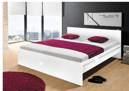
Postel Malmö, 4 499 Kč