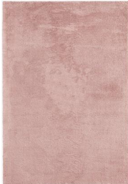
Koberec Fuzzy 1 499 Kč

Ačkoliv už se pomalu blíží jaro, rána bývají ještě chladná. Při vstávání z postele, tak možná oceníte měkoučký koberec. Věční zmrzlíci zase mohou sáhnout po hřejivých dekách, které chlad spolehlivě zaženu.