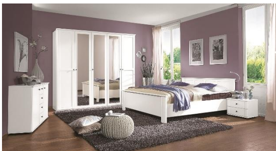
Postel Chalet, 14 799 Kč

Zásadní vliv na odpočinek mají nejen barvy v ložnici, ale také samotná postel. Při jejím výběru je třeba zohlednit celou řadu faktor, jako jsou tělesné rozměry či váha budoucích majitelů. Kvalitní postel by měla poskytovat dobrou oporu těla a nezapomínejte ani na proudění vzduchu, které je pro životnost matrace zásadní. V ASKO – NÁBYTEK mají celou řadu variabilních systémů do ložnice, které jsou zákazníky velmi vyhledávané. Společně s postelí si tak můžete vybrat komodu, šatní skříň či další druhy nábytku a vše je v jednotném designu.