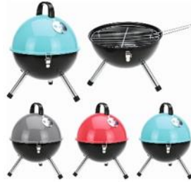
Kotlíkový gril, 449 Kč