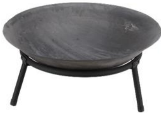
Litínové ohniště, 799 Kč

Ať už si vyberete jakoukoliv variantu, určitě se vám budou hodit i praktické grilovací kleště, vidličky, obrabečky či různé mřížky, které vám usnadní přípravu vašich oblíbených grilovaných pochoutek.