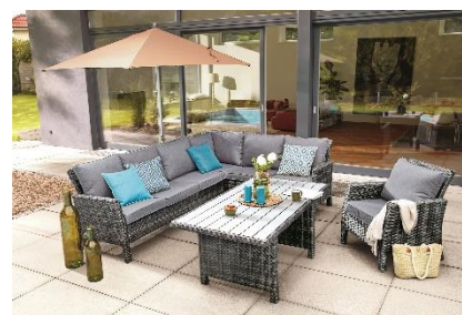
Zahradní set Madison, 24 999 Kč