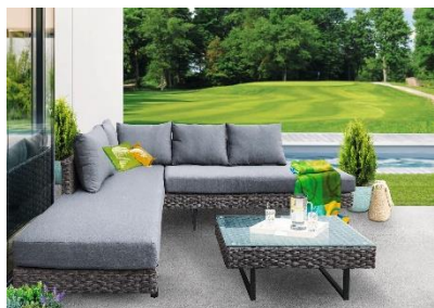
Sedací souprava Singapur, 14 999 Kč

Při výběru zahradního nábytku je důležitý také materiál, ze kterého je vyrobený. Jedním z nejoblíbenějších je pro svou snadnou údržbu umělý ratan. Ve stejném stavu vydrží mnoho sezón a snadno odolávají i nepříznivému počasí. Stačí schovat polstrované části a nábytek může zůstat venku bez ohledu na roční období. Podobně odolný je i kovový nábytek. Většinou je vyroben z hliníku, který je lehounký a nepodléhá korozi, nebo z oceli. Kovový nábytek je stabilní, ale pro někoho mohou být nevýhodou jeho tepelné vlastnosti. Při dlouhém pobytu na slunci se dokáže vyhřát na vysokou teplotu a po chladné noci je naopak velmi studený na dotyk. Dřevěný nábytek v sobě má určité kouzlo, které zútulní každou terasu či zahradu. Je příjemný na dotyk a snadno se přemísťuje. Jeho nevýhodou je nutnost uklízet jej po sezóně do vnitřních prostor a také potřeba pravidelného ošetřování dřeva.