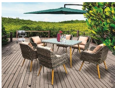
Jídelní set Tropicana, 15 999 Kč