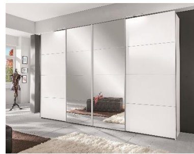
Šatní skříně Brüssel, 16 999 Kč