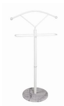
Němý sluha Bello, 789 Kč

Přemýšlíte nad tím, kam odložit nošené oblečení, které si ale ještě chcete vzít na sebe, než ho dáte do pračky? To je problém, který řeší snad každá domácnost. Existuje celá řada pomocníků od tzv. němých sluhů až po nástěnné věšáky či šatní panely, na které můžete nošené oděvy odložit a v případě potřeby jsou zase snadno po ruce.