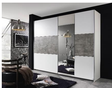
Šatní skříně Prenzlau, 8 999 Kč