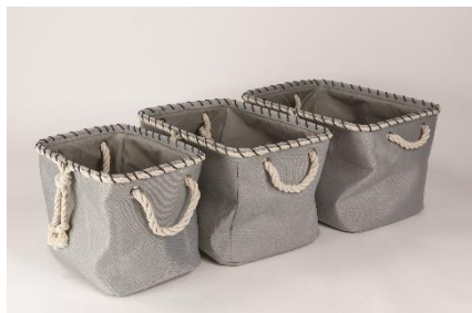
Látkový koš Erasbita, 49 Kč

Oblečení poskládané do komínků? Této metodě již dávno odzvonilo. Daleko přehlednější je uspořádat věci nastojato a narovnat je vedle sebe nejlépe do úložných boxů nebo zásuvek. Když si pak půjdete vybrat nějaký kousek, nerozpadne se celý komínek, a navíc máte větší přehled o tom, jaké kousky se ve vašem šatníku nachází.