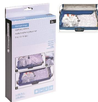
Vakuové pytle. 129 Kč