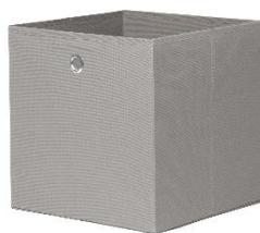
Úložný koš Alfa, 99 Kč