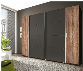
Šatní skříně Lotto, 11 999 Kč

Abyste se ve své šatní skříně dokonale orientovali a vždy věděli, kam pro danou věc sáhnout, je dobré se zaměřit také na její logické uspořádání. Skříně většinou kombinují systém polic, případně zásuvek a šatních tyčí. Pro snadný přehled byste měli věci ukládat v pořadí odshora dolů stejně jako u postavy. Pokrývky hlavy či šátky by měly být umístěny v horních policích, nejlépe v úložných boxech, pro které snadno sáhnete. Veškeré halenky, saka, bundy či kabáty patří na ramínko. Ty volte v jednotném designu, skříň pak vypadá daleko úhledněji. Ostatní věci, jako jsou kalhoty, sukně či boty, patří spíše do spodních zásuvek či polic.