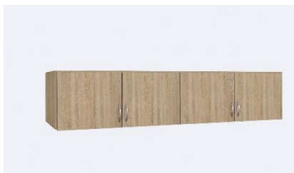
Skříňový nástavec Case, 2 999 Kč