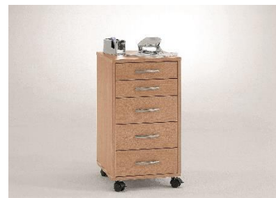
Zásuvkový kontejner, 1 499 Kč